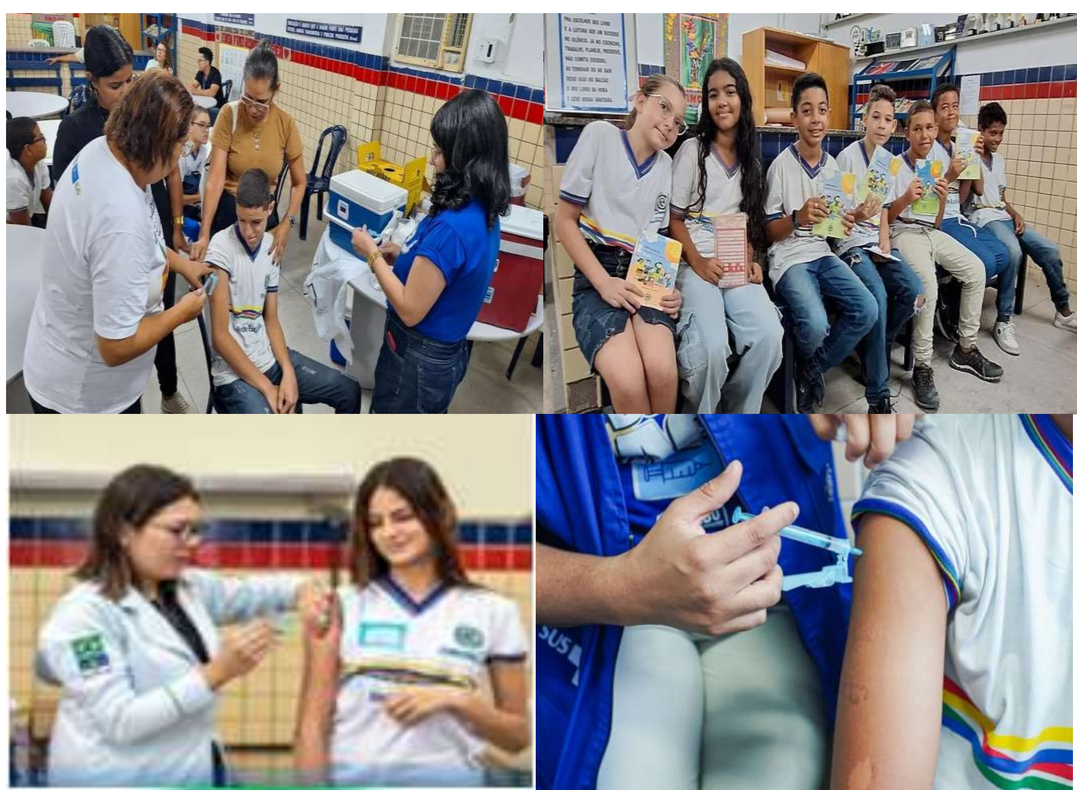
Figura 1 – Vacinação em escolas de PE

Adoção de estratégias de intensificação da imunização, com destaque para a vacinação no ambiente escolar.