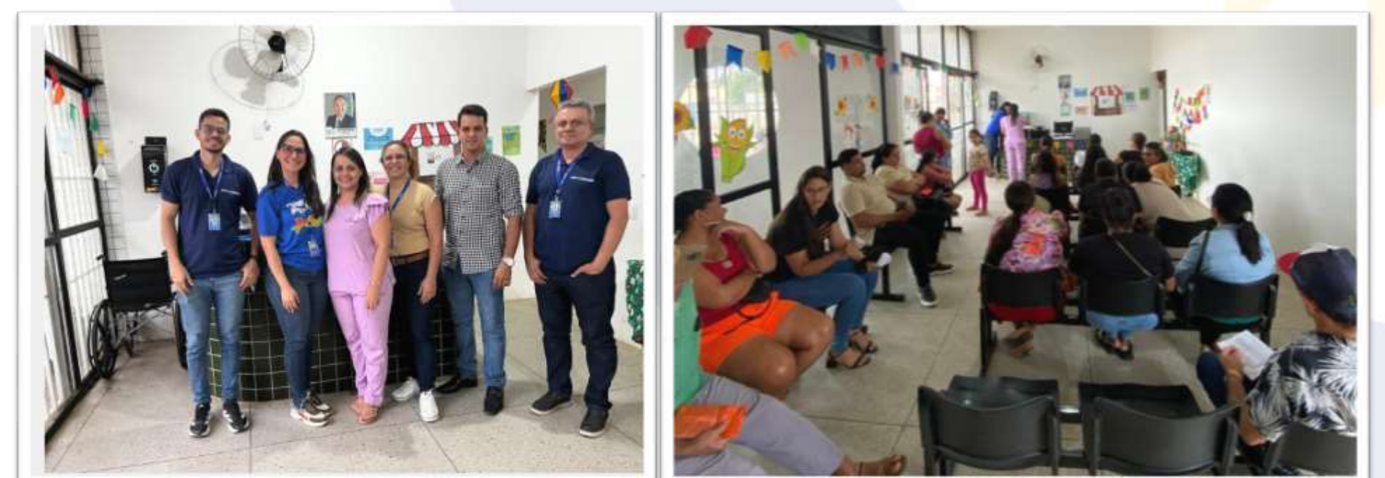
Figura 2 e 3: Usuários sendo atendidos em São José do Egito

A experiência ampliou o acesso a consultas e exames especializados em Ortopedia, Otorrinolaringologia e Oftalmologia, reduzindo o tempo de espera e a necessidade de deslocamentos para outras regiões. Houve fortalecimento do vínculo entre profissionais da Atenção Primária e especialistas, com melhora na resolutividade e integração das redes de cuidado. Observou-se ainda maior eficiência na regulação e satisfação dos usuários, consolidando o modelo regionalizado como estratégia eficaz de gestão.