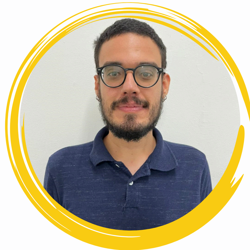
Idealizador do Podcast Fala Trabalhador (a)! Roteiro e Edição Paulo Lira - GVSAT