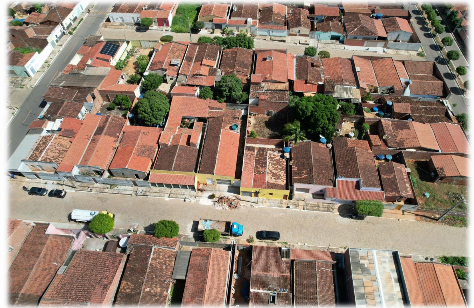
Imagens aéreas capturas pelo drone do setor em 29/09/2025.