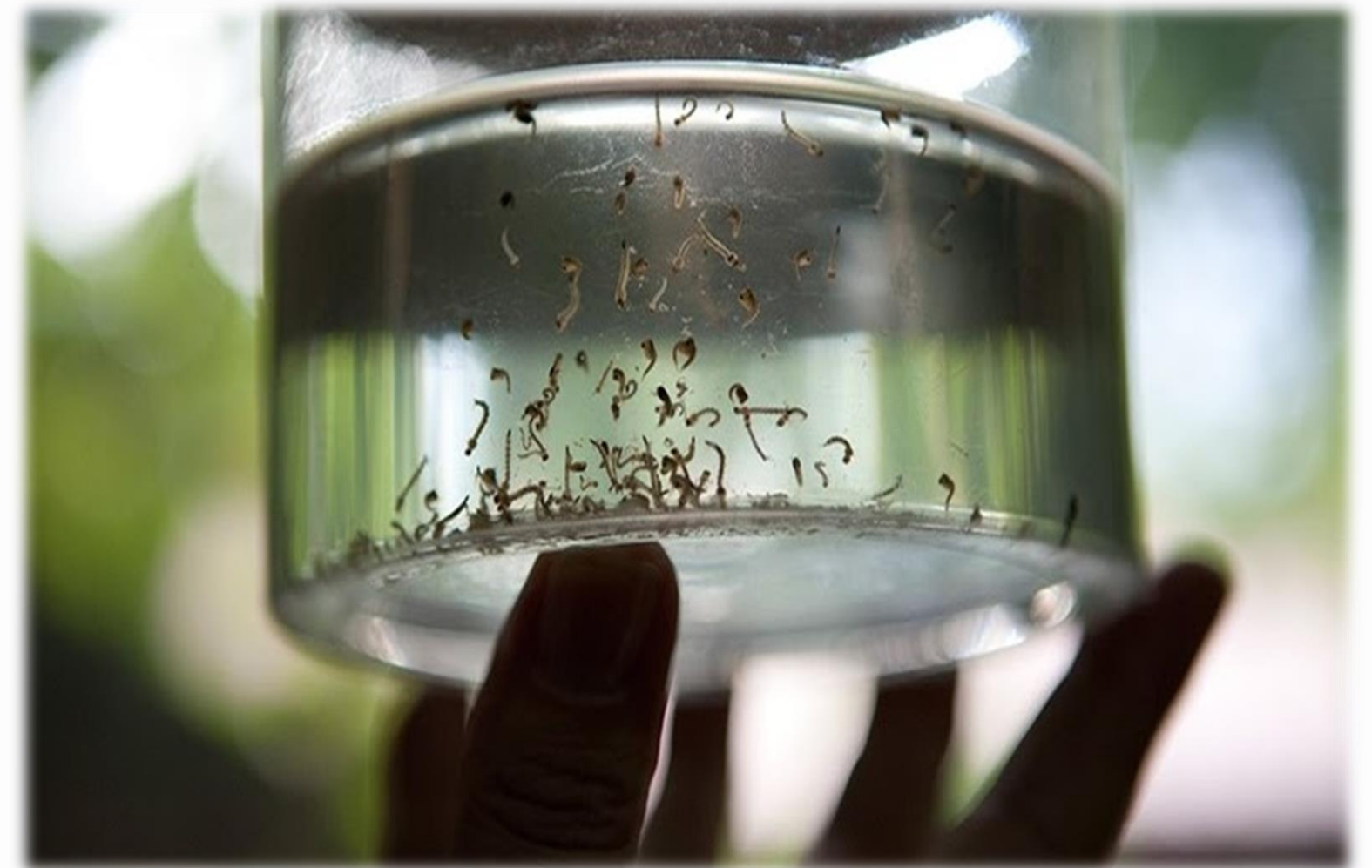
Reservatório contendo larvas e pupas do mosquito Aedes Aegypti .