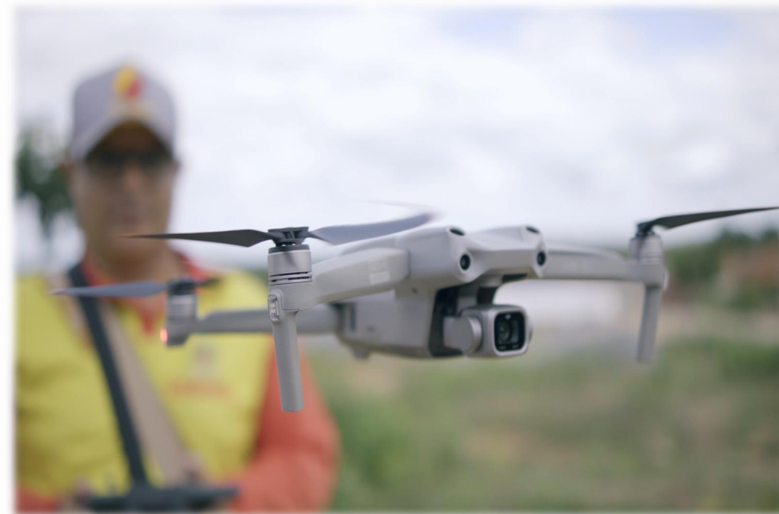
Veículo Aéreo não Tripulado (VANT).